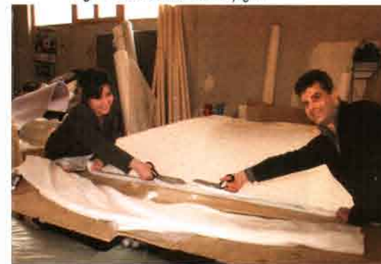
Кројачко-шнајдерски гео радионице